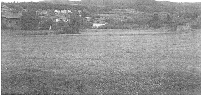
Terreno en el que se plantará nuevo viñedo. A la izquierda, edificaciones que se remodelarán, y a la derecha palomar que se convertirá en sala de cata

Han adquirido tres edificaciones y una hectárea de terreno anejas a la actual Bodega para dedicarlas a ampliación de la cava, zona social y oficinas, así como a un proyecto de enoturismo. Además, plantarán nuevos viñedos de mencia