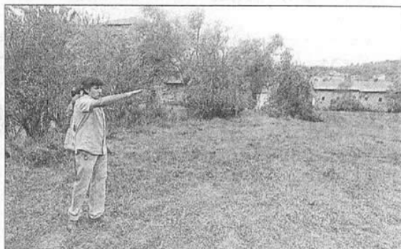
Marqués señala los terrenos de la ampliación. L. DE LA MATA

hace un siglo. Para refrendar la teoría en Pittacum apostaron por la práctica y desarrollaron ayer una cata con sus tres buques insignia. Arrancaron en el caserón solariego con el «Tres obispos», intercalaron el Pittacum y arrasaron con el de apellido Aurea. El vino habló.