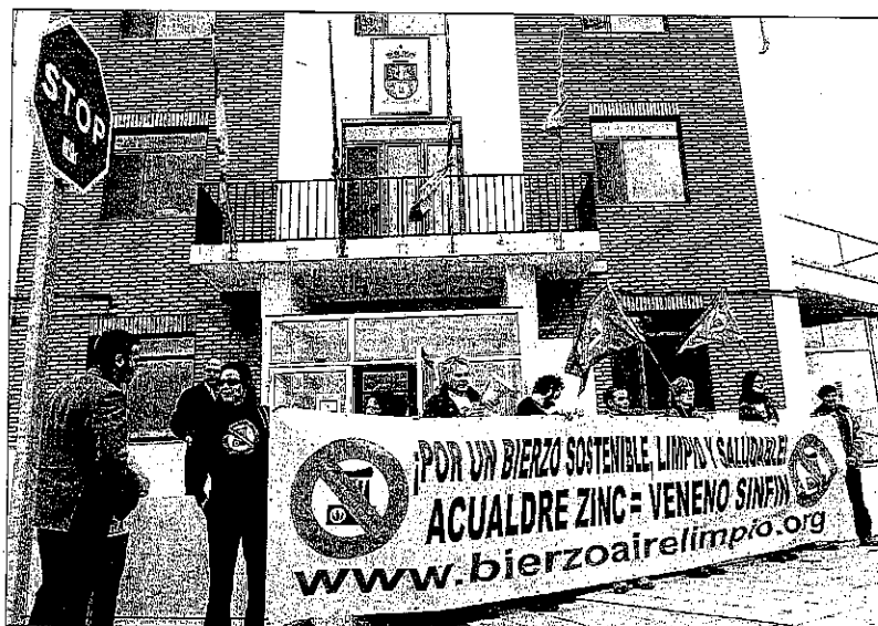
Bierzo Aire Limpio se ante la casa consistorial

En el mismo pleno, desde la oposición municipal se intentó