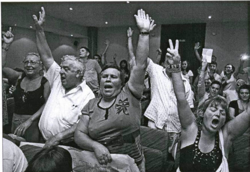
Los vecinos de Bárcena cortaron el debate plenario una y otra vez para manifestar su enfado y su desacuerdo.

El Pleno monográfico sobre la situación del transporte urbano y la «necesaria modificación» para paliar un déficit «inasumible», según reconoció el portavoz municipal, Reiner Cortés, trajo al debate político críticas de la oposición reiteradas prácticamente desde la puesta en marcha