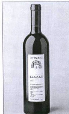
Pittacum Barrica 2006.

no contabilizó transporte de mercancías, igual que el de Salamanca. En número de operaciones en junio, la menor caída fue la de Salamanca, con 1.375, lo que supone el 5,8%. Por detrás se situó León, con 475 operaciones, el 19,6% menos y Valladolid, con 890, el 34,4% menos. En el caso de los dos últimos, superaron la media anotada por el conjunto de comunidades, donde el descenso fue del 12,2% respecto a junio de 2008. En cuanto a la recepción de mercancías, León registró un volumen de 500 kilogramos, una caída del 72,2% respecto a 2008. Sin embargo, Valladolid aumentó el 111,1%.